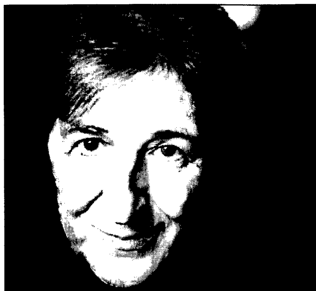
Giorgio Gaber: attesa per il suo duetto con Adriano Celentano

Qualcuno era comunista «perchè forse era solo una forza, un volo, un sogno, era solo uno slancio, un desiderio di cambiare le cose, di cambiare la vita» canta il «Signor G» in uno dei suoi pezzi più famosi. E questo rende il titolo del nuovo album, il primo in vent'anni svincolato da progetti teatrali, pesante come un macigno. Gaber non è politicamente corretto perchè il politicamente corretto è l'ipocrisia del buonismo conformista. E invece lui «ti urta, ti fa arrabbiare, ma ti costringe a pensare anche se non è sempre completamente condivisibile», come spiega Antonio Ricci nelle